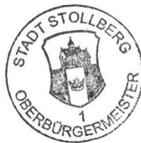
Marcel Schmidt Oberbürgermeister