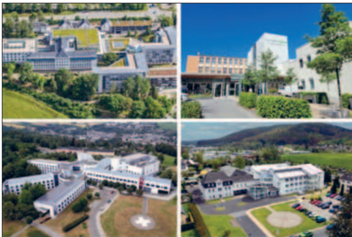
Häuser des Erzgebirgsklinikums

Das Erzgebirgsklinikum optimiert seine Patientenversorgung durch die Einführung einer zentralen Terminvergabe. Ab 01.12.2024 können Patientinnen und Patienten ihre Termine für alle stationären und ambulanten Einrichtungen des Klinikums über eine zentrale Anlaufstelle vereinbaren. Ziel ist es, die Terminplanung zu vereinfachen, Wartezeiten zu reduzieren und die Erreichbarkeit zu verbessern. Mit der neuen zentralen Terminvergabe wird ein einheitlicher, standortübergreifender und effizienter Prozess eingeführt. Zusätzlich zur Kontaktmöglichkeit mit der jeweiligen Fachabteilung erhalten die Patienten somit die Möglichkeit mit einem Anruf einen gewünschten Termin zu erhalten.