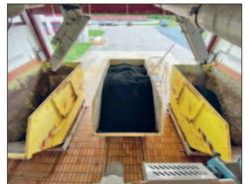
Bild 4: ... zum Containerraum der Schlamm- presse

Die WAD GmbH betreibt zwei Faultürme, die gleichmäßig mit Schlamm beschickt werden. Der Prozess der Klärschlammfaulung erfüllt mehrere Aufgaben: Zum einen wird der Schlamm stabilisiert, was seine biologische Aktivität eindämmt und damit eine Geruchsbildung vermeidet. Zum anderen entsteht dabei ein Faulgas, das als Energieträger genutzt wird. Zusätzlich wird die Menge, die entsorgt werden muss, so reduziert. Der Prozess läuft unter anaeroben Bedingungen – also unter Ausschluss von Sauerstoff – bei einer Temperatur von 36 bis 38 °C ab. Dabei erfolgt die Durchmischung des Schlammes, eine kontinuierliche Beschickung und der Abzug von ausgefaultem Schlamm. Im Jahr 2023 haben wir die Faultürme mit durchschnittlich 147 m 3 pro Tag beschickt.