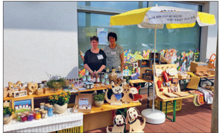
Lebenshilfe Stollberg gGmbH Hohensteiner Straße 39, 09366 Stollberg

Im Erzgebirgskreis sind insgesamt über 300 Mitarbeiterinnen und Mitarbeiter bei der Lebenshilfe Stollberg in verschiedenen sozialen Einrichtungen und Diensten tätig, darunter fünf Kindertagesstätten,