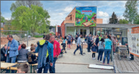
Schwibbogen-Anschieben am 13. Mai 2023